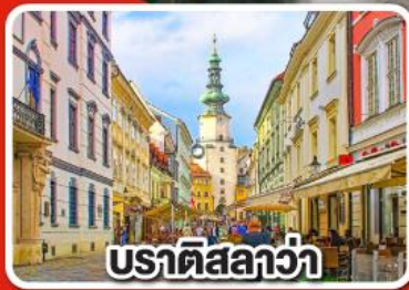
ปราติสลาวา

เที่ยวเมือง คาร์โลวารี เมืองแห่งสปา พร้อมเมนูพิเศษเปิดโบฮีเมีย