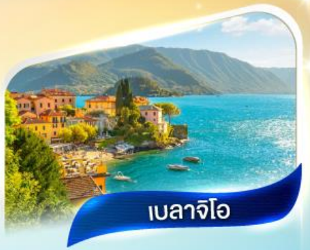
เบลาจีโอ