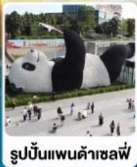
รูปปั้นแพนด้าเซลฟ์