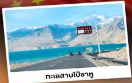
ทะเลสาบไปซาทุ

“ซินเจียงใต้” ดินแดนแห่งทะเลทราย สัมผัสวัฒนธรรมของชาวซินเจียงอุยกูร์