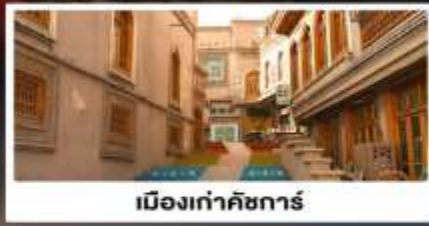
เมืองเก่าคัชการ์