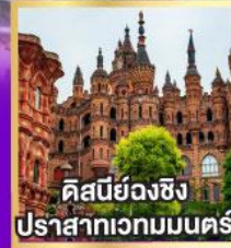
คิสนียฉงชิ่ง ปราสาทเวกมมนคร