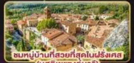
ชมหมู่บ้านที่สวยงามที่สุดในฝรั่งเศส (มูสดีเยแซงกมาร์)