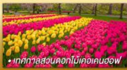
• เทศกาลสวนดอกไม้เคอเคนฮอฟ