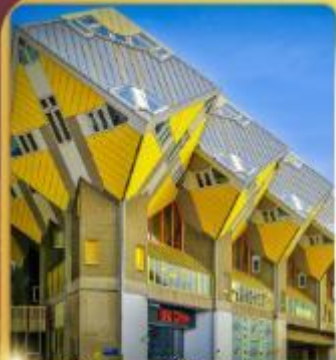
บ้านลูกเต่า โคร็กคูมูส

“ล่องเรือหลังคากระจก” ชมกรุงอัมสเตอร์ดัม