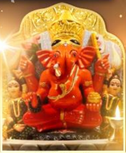
องค์สิทธินายิก