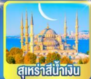
สุหรัสน้ำเงิน