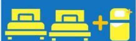
เตียง 3 ก้น ที่นอนเสริม TRIPLE