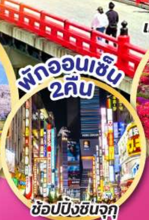
พักออนเซ็น 2คืน