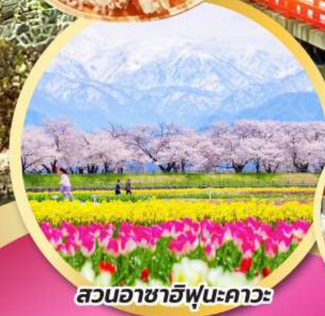
สวนอาซาฮิฟุเนะคาวะ