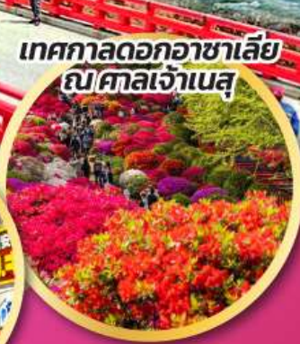
เทศกาลดอกอาซาเลีย ณ ศาลเจ้าเนสุ