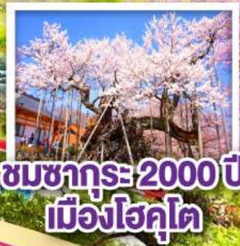
ชมซากุระ 2000 ปี เมืองโฮคุโต